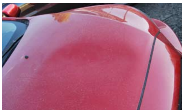
▲ Попадание в цвет и гарантия на выполненные работы — основные преимущества локальной покраски на станциях с именем

степени повреждения, но и от марки автомобиля (самым сложным, а соответственно дорогим, считается цвет «белый перламутр»), масштаба повреждения, а также потребности в дополнительных работах, таких как демонтаж и монтаж детали. Кстати, даже за оценку могут потребовать денег, немного, но все же... Лучше узнать по телефону, является ли платной эта услуга на сервисе. Если срок гарантии на автомобиль не истек, то ехать на дилерскую станцию, иначе