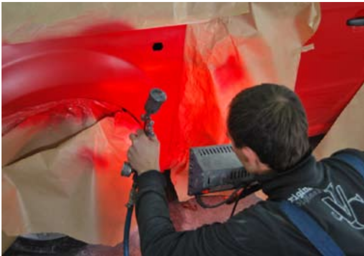
▲ Ровный направленный свет позволяет увидеть переходы цвета, если они есть. Окончательную проверку все же лучше проводить при солнечном свете.