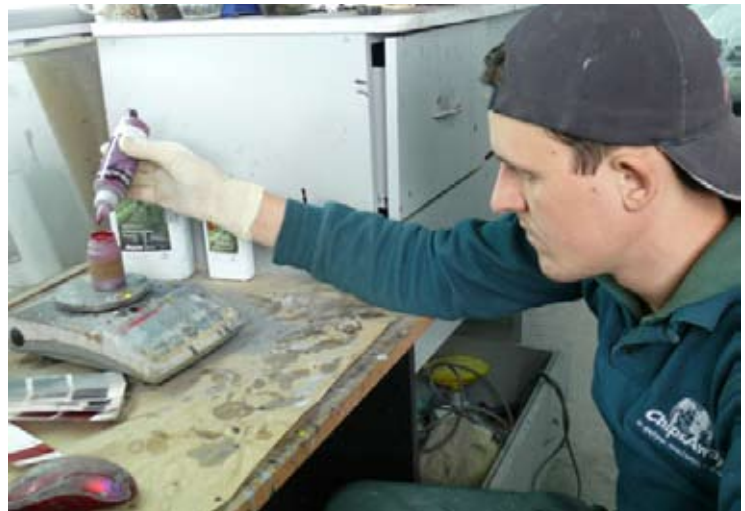
▲ Подбор красок — важнейший этап в процессе покраски. Точность весов составляет 0,001 грамма — этой доли достаточно, чтобы повлиять на цвет