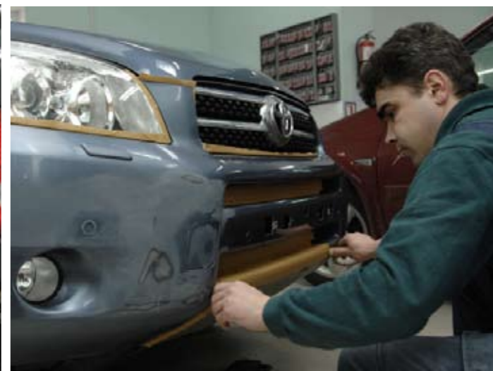
▲ Обычно на поверхности одной детали есть несколько повреждений. Их красят сплошным слоем — так и быстрее, и меньше «стыков» краски

томобиль с повреждениями. Мастера-приемщики вряд ли оценят стоимость работ по телефону или же посмотрев фотографии автомобиля, так что для себя, какого уровня сервис вы предпочитаете. Итоговая стоимость работ зависит не только от